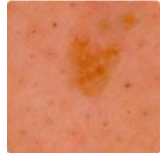
シミチェック画像 (M30Nレンズ使用)

お肌のキメチェックやシミチェックは標準添付のM30NレンズでOK! お肌のチェックに